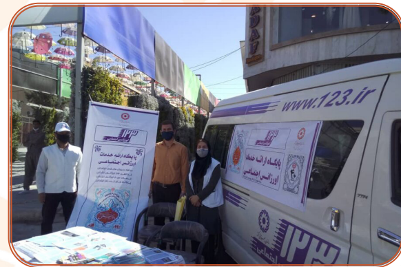
مانور اورژانس اجتماعی