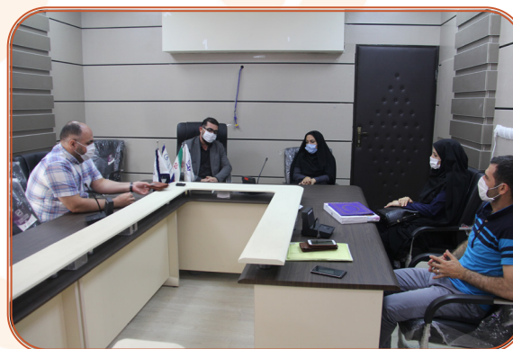
نشست مدیر کل با اعضا خانه مطبوعات