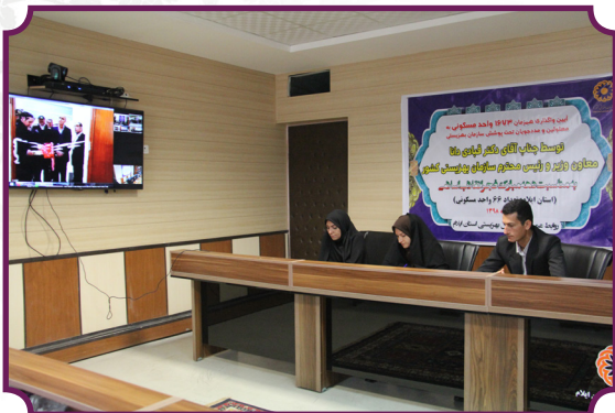
افتتاح واحد های مسکونی مددجویان بصورت ویدیو کنفرانس