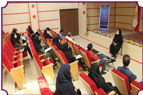
کارگاه آموزشی صندوق های خرد محلی ویژه افراد دارای معلولیت