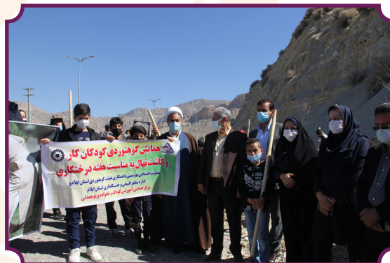
همایش کوهنوردی و کاشت درخت کودکان کار به مناسبت هفته درختکاری