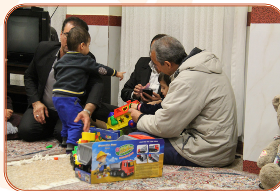
اهدا وسایل اسباب بازی توسط خیرین به کودکان شیرخوارگاه