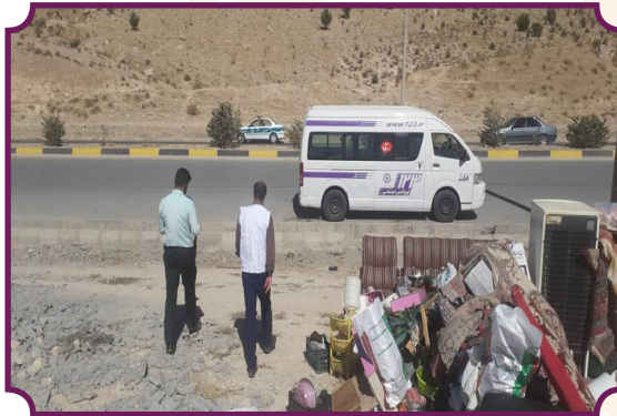
گشت تیم اورژانس اجتماعی و ارایه خدمات به افراد بی خانمان