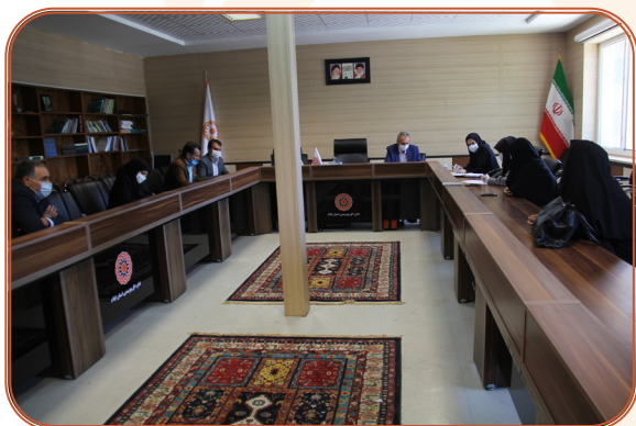
مصاحبه متقاضیان مراکز مثبت زندگی