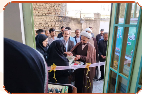
افتتاح کلینیک مددکاری دره شهر