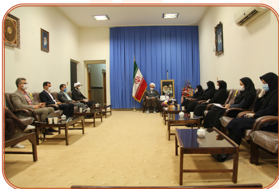
دیدار مدیر کل و اعضای شورای معاونین با نماینده ولی فقیه در استان و امام جمعه ایلام