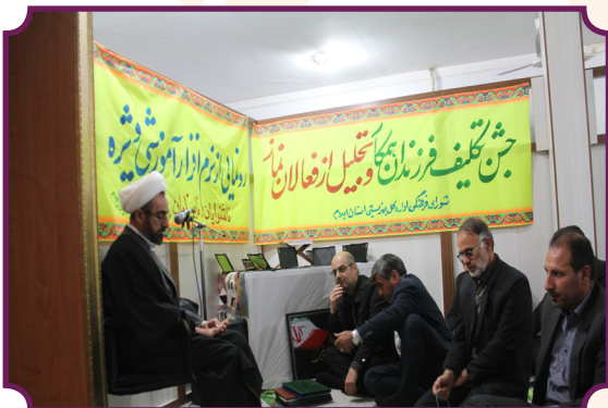
بزرگداشت سردار حاج قاسم سلیمانی