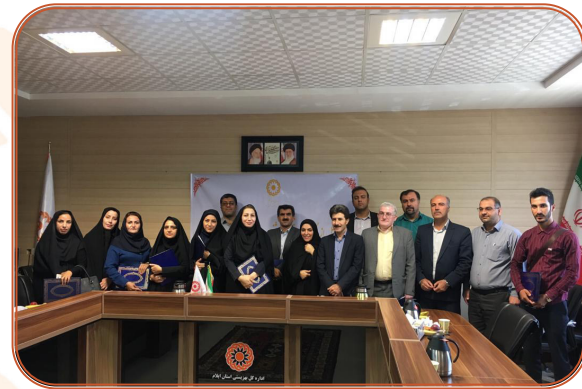
نخستین جشنواره بهزیستی، رسانه و مسئولیت اجتماعی