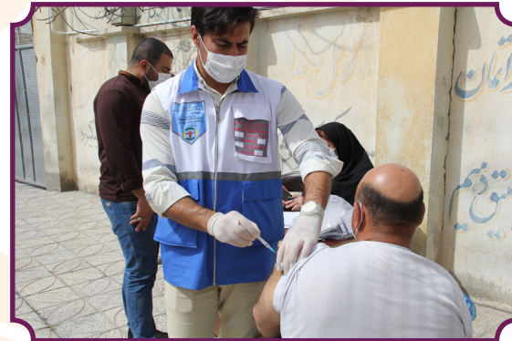
واکسیناسیون کووید ۱۹ مددجویان مراکز