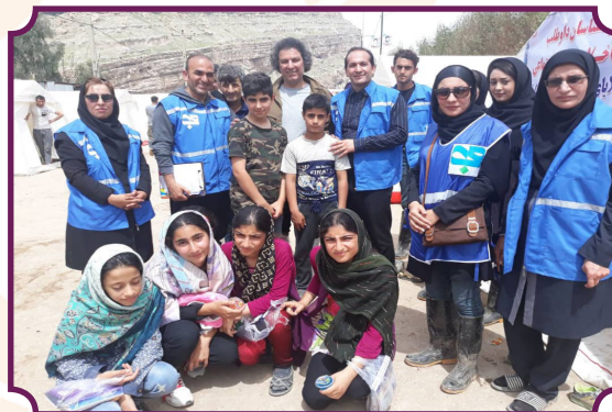
اعزام تیم محب ایلام به مناطق سیل زده شهرستان پلدختر