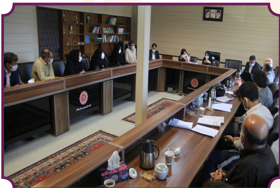
جلسه کارگروه اشتغال