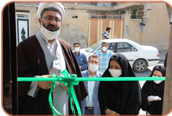
افتتاح منازل مسکونی مددجویان