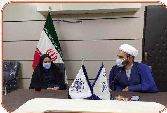
حضور مدیر کل در خبرگزاری شبستان