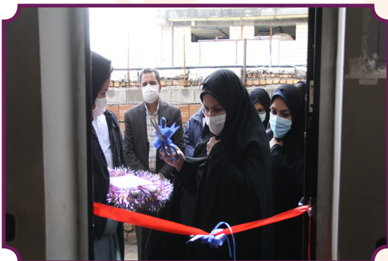
افتتاح کمپ ترک اعتیاد بانوان