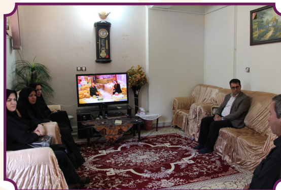
بازدید از منزل سالمندان