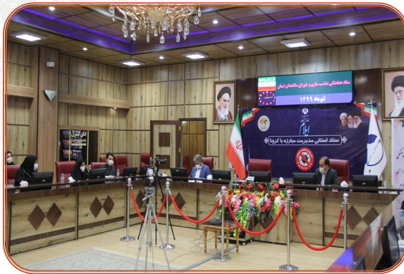
نشست شورای سالمندان در استانداری