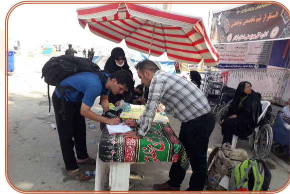
خدمت رسانی به زائرین اربعین حسینی در مرز مهران