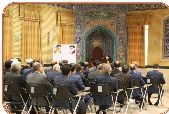
کلاس اخلاق مدیران به میزبانی بهزیستی