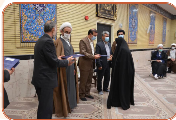
تقدیر از مدیر کل بابت کسب رتبه برتر فعالیت‌های توسعه و ترویج نماز