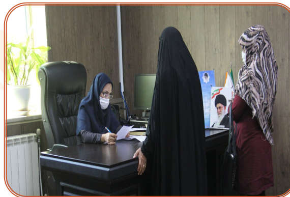
ملاقات عمومی مدیر کل با مددجویان