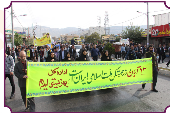
حضور کارکنان در راهپیمایی ۱۳ آبان