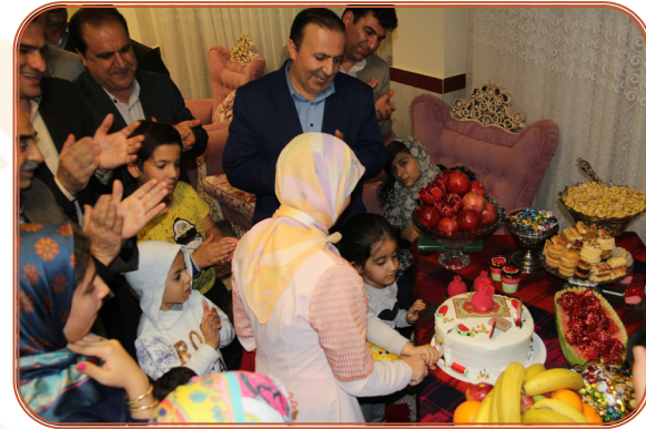
جشن شب یلدا در شیرخوار گاه با حضور معاون سیاسی امنیتی استاندار