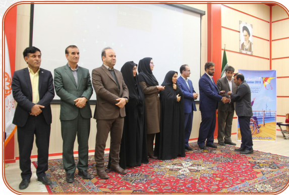
اختتامیه چهارمین سوگواره ملی عکس مسیر سبز ویژه اربعین حسینی