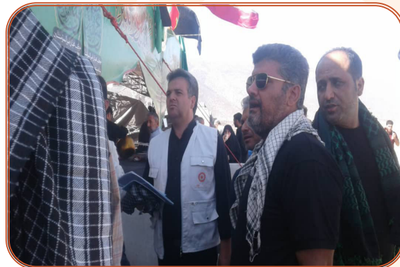
خدمت رسانی به زائرین اربعین حسینی در مرز مهران