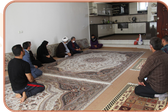
بازدید از منزل مددجویان