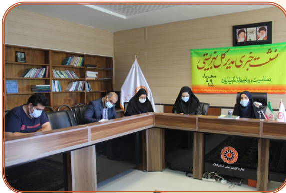
نشست خبری مدیر کل بهزیستی