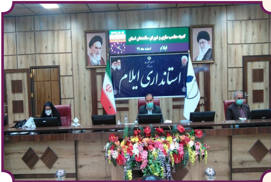
کمیته مناسب سازی و شورای سالمندان استان