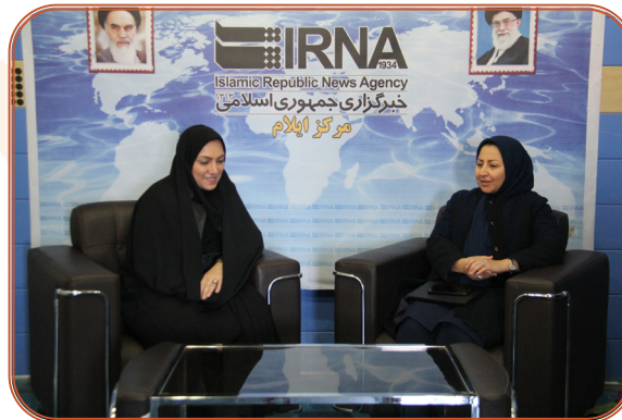
حضور مدیر کل در خبرگزاری ایرنا