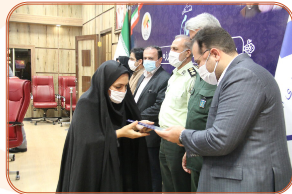
تقدیر از مدیر کل در شورای هماهنگی مبارزه با مواد مخدر