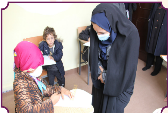
برگزاری مسابقه ورزشی و نقاشی کودکان کار