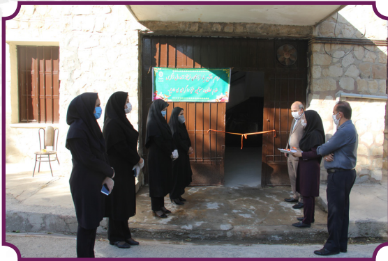
افتتاح بنیاد فرزندگان