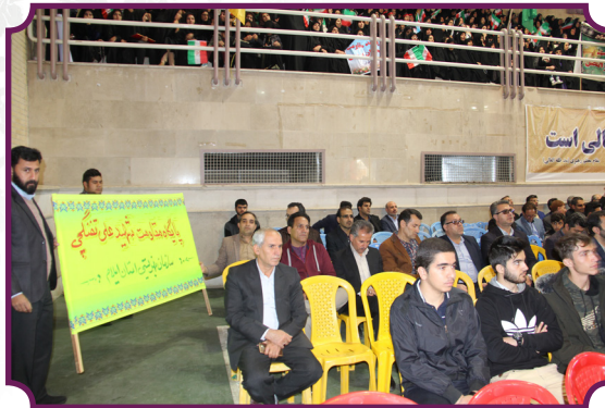
حضور کارکنان در گردهمایی بسیجیان