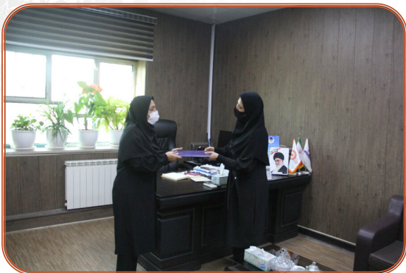
تقدیر از خبرنگاران دارای معلولیت به مناسبت روز خبرنگار