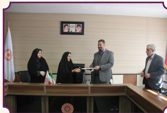
انعقاد تفاهم نامه با نظام صنفی کشاورزی