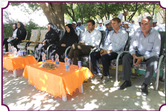
برگزاری ویژه برنامه هفته سلامت روان در مرکز بیماران روانی مزمن ایلام