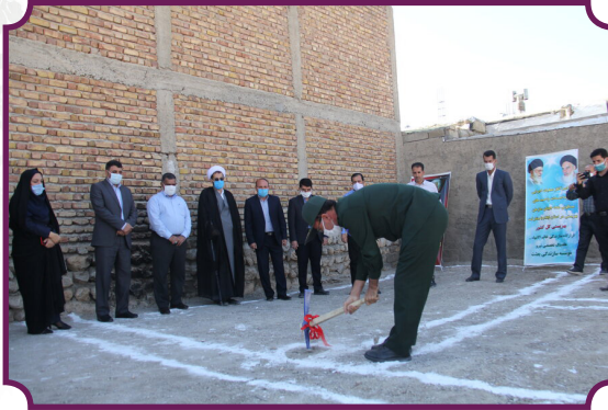
کنگ زنی مسکن مددجویان با مشارکت سپاه