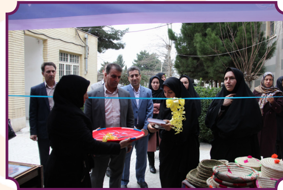
برپایی نمایشگاه صنایع دستی زنان سرپرست خانوار