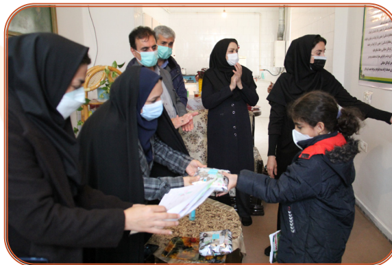
تقدیر از کودکان کار