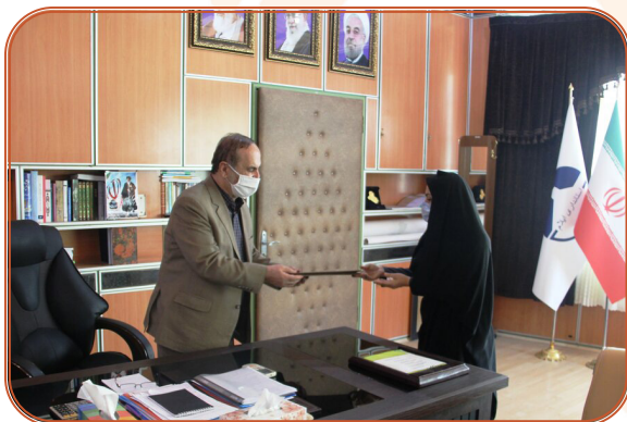
اهدا لوح تقدیر معاون وزیر و رییس سازمان بهزیستی کشور به استاندار ایلام