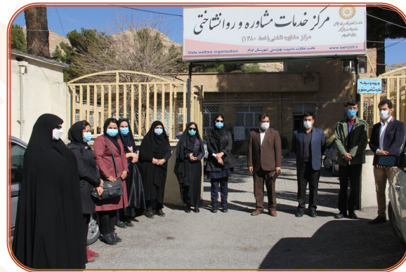
تور رسانه ای بازدید از مرکز مشاوره ۱۴۸۰