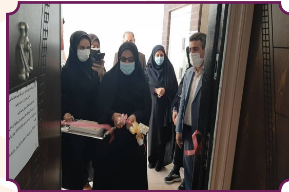
افتتاح مرکز مشاوره