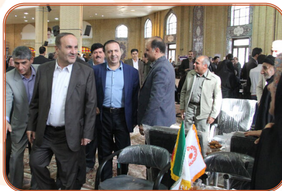
بازدید استاندار از میز خدمت بهزیستی در مصلى امام خمینی(ره) ایلام