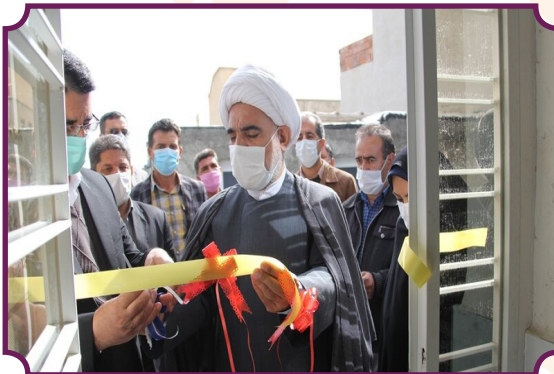
افتتاح منزل مسکونی مددجویان