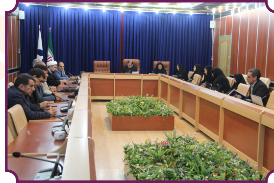
نشست شورای مشارکت های مردمی در استانداری