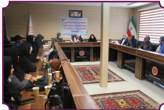
سفر مدیر کل دفتر پیشگیری و درمان اعتیاد کشور به ایلام