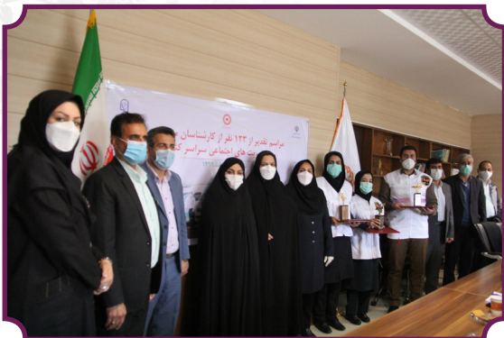
تقدیر از کارشناسان اورژانس اجتماعی با حضور مدیر کل دفتر بانوان و خانواده استانداری ایلام