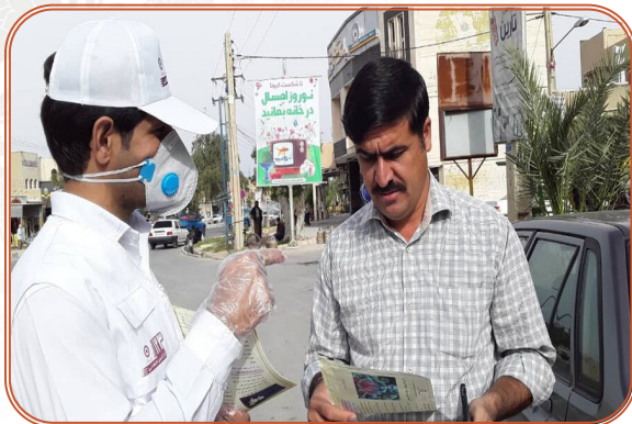
آگاه سازی مردم از کرونا توسط نیروهای اورژانس اجتماعی