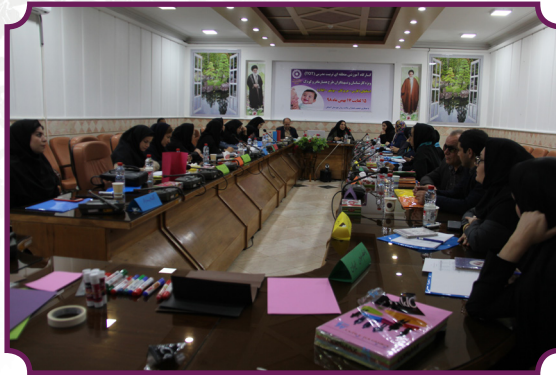
کارگاه آموزشی منطقه ای تربیت مدرس طرح همیار مادر و کودک