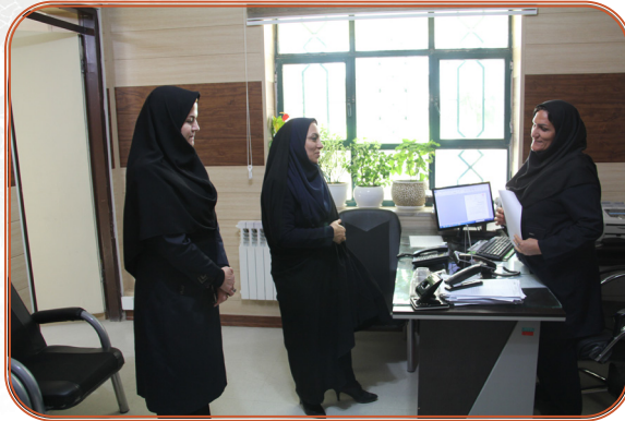
تبریک مدیر کل به کارکنان به مناسبت روز زن