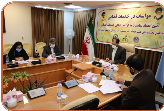
تفاهم نامه انعقاد همکاری با دادگستری