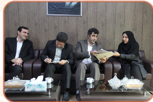
انعقاد تفاهم نامه همکاری با اداره کل کتابخانه ها