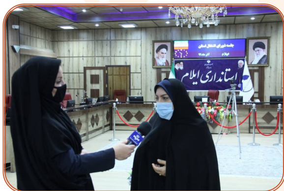
مصاحبه مدیر کل با صدا و سیما