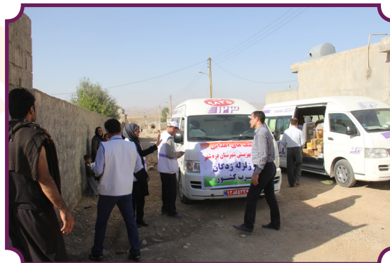
امداد رسانی نیروهای اورژانس اجتماعی به زلزله زدگان دره شهر