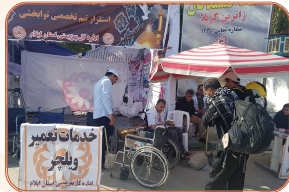
خدمت رسانی به زائرین اربعین حسینی در مرز مهران