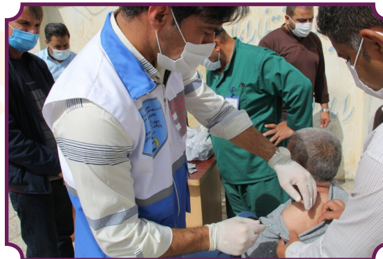
واکسیناسیون کووید ۱۹ مددجویان مراکز