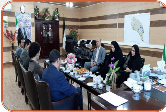
دیدار مدیر کل با فرماندار ایوان