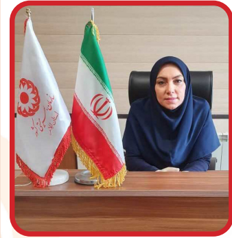
پیام مدیرکل بهزیستی استان ایلام