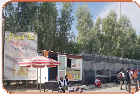
خدمت رسانی به زائرین اربعین حسینی در مرز مهران