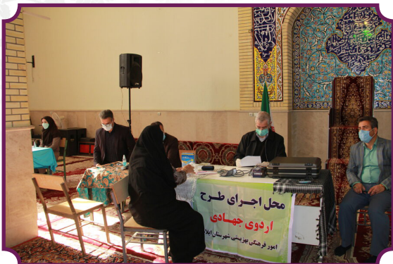
اعزام مددجویان به اردوی زیارتی