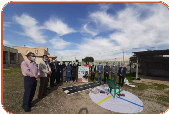
اجرای نمایش خیابانی با موضوع اعتیاد