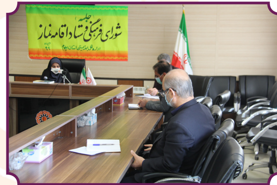
شورای فرهنگی و اقامه نماز