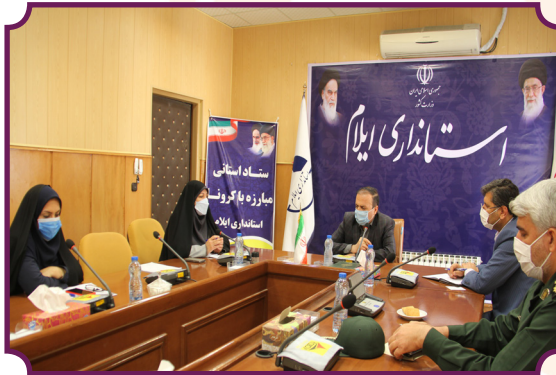
سفر معاون توسعه پیشگیری و درمان اعتیاد بهزیستی کشور به ایلام