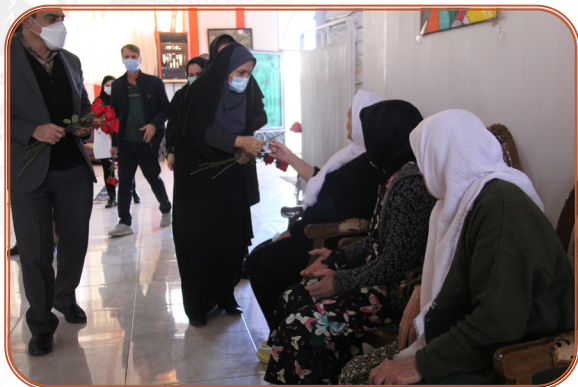
تبریک روز مادر به مادران خانه سالمندان