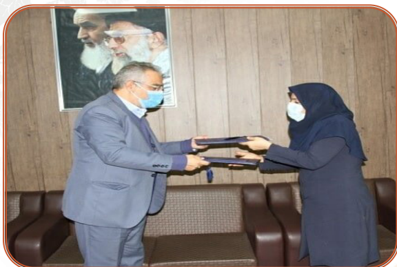
انعقاد تفاهم نامه همکاری با اداره کل زندان ها