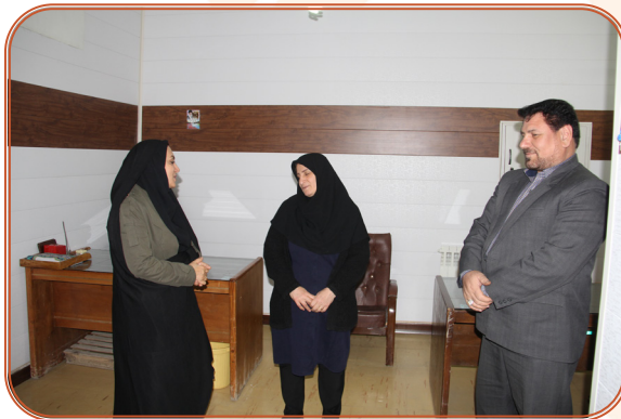
تقدیر مدیر کل از همکاران بازنشسته