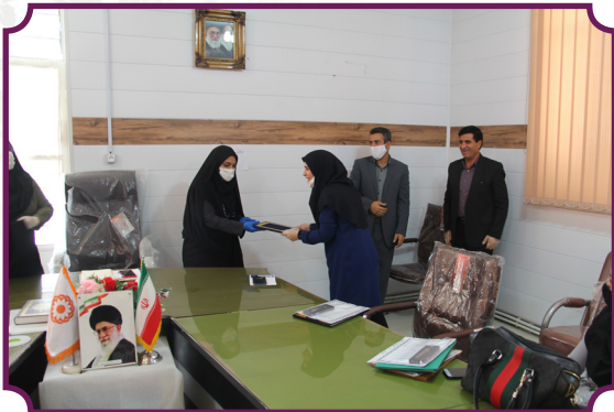
تجلیل از مشاوران مرکز ۱۴۸۰