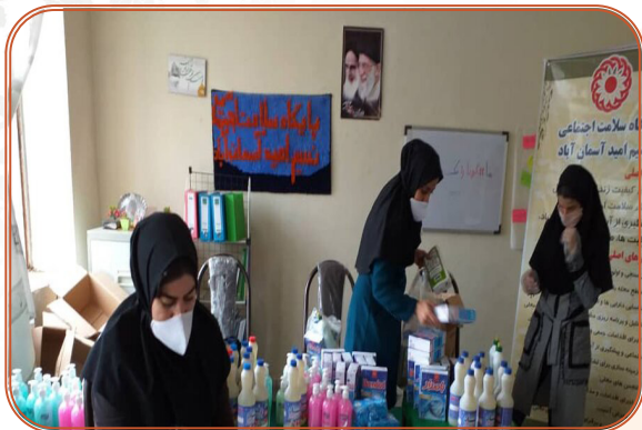
توزیع اقلام بهداشتی بین مددجویان