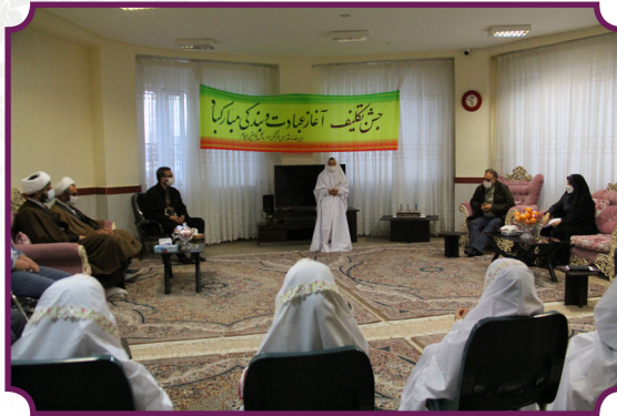
جشن تکلیف کودکان بی سرپرست با حضور امام جمعه و مدیر کل دفتر کودکان بهزیستی کشور