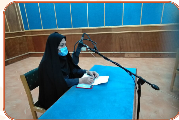
حضور مدیر کل در برنامه رادیویی ایلام و توسعه