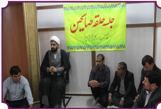
نشست حلقه صالحین بسیج