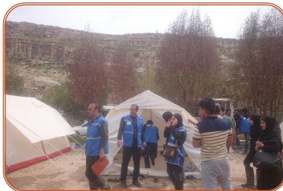
اعزام تیم محب به سیل زدگان شهرستان پلدختر