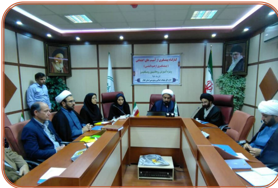
کارگاه پیشگیری از آسیب های اجتماعی ویژه مبلغان و روحانیان