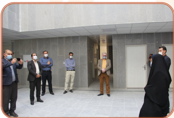
تور رسانه ای بازدید از روند احداث مرکز جامع آسیب دیدگان اجتماعی