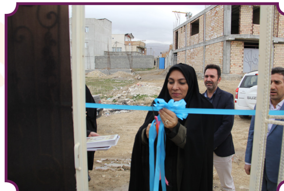
افتتاح واحد مسکونی مددجویان