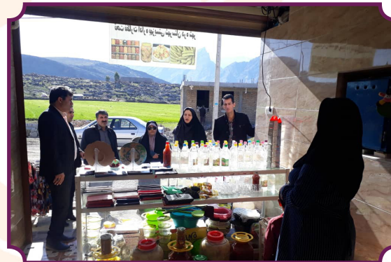
افتتاح طرح اشتغالزایی مددجویان