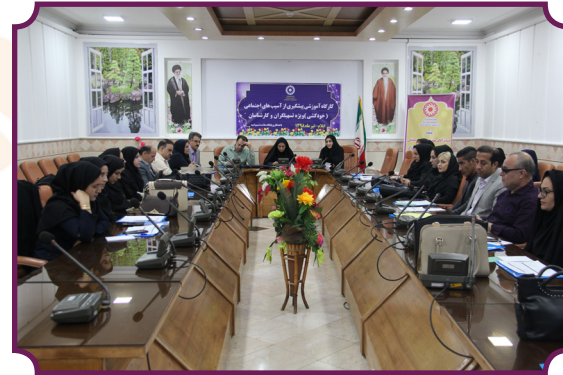
کارگاه پیشگیری از آسیب های اجتماعی