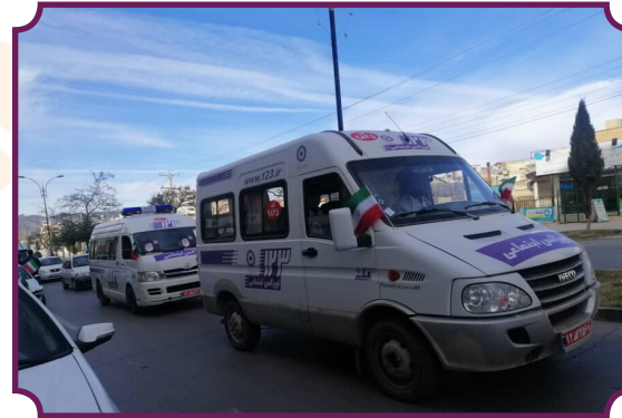
حضور خودروهای اورژانس اجتماعی در راهپیمایی خودرویی ۲۲ بهمن