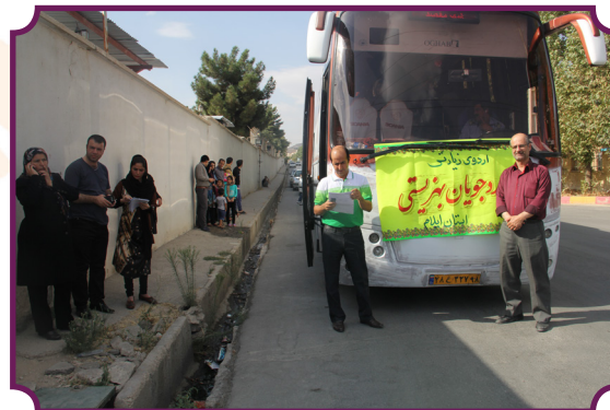
محل اجرای طرح اردوی جهادی