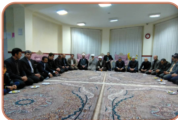
حضور نماینده ولی فقیه در استان و امام جمعه و خیرین در شیرخوارگاه