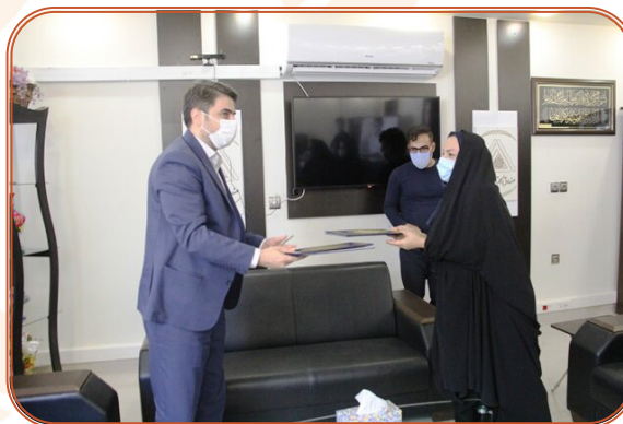
انعقاد تفاهم نامه همکاری با صندوق کارآفرینی و امید