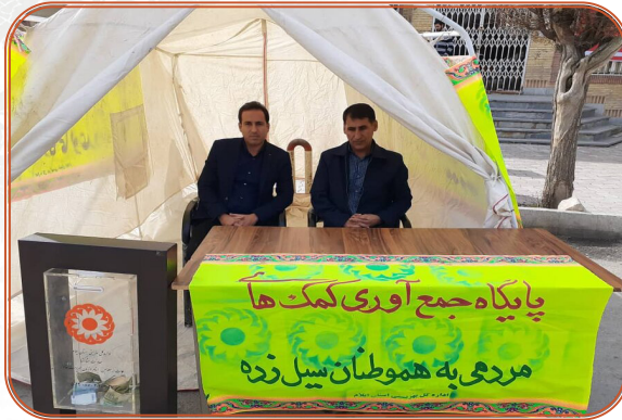
پایگاه جمع آوری کمکهای مردمی به هموطنان سیل زده