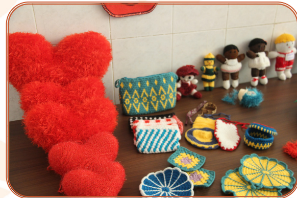
نمایشگاه آثار هنری دختران خانه سلامت