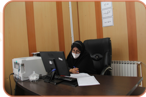
پاسخگویی مدیر کل در سامانه سامد