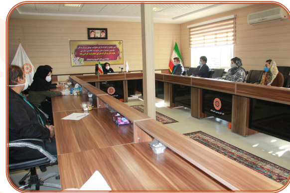
اختتامیه نخستین جشنواره ملی دنوشته (نگاه من، نیاز من)