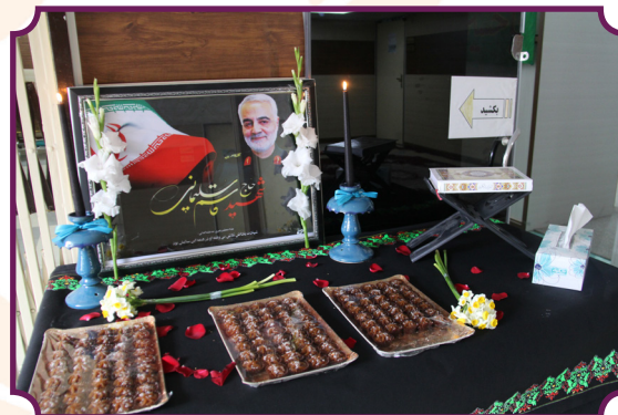
جشن تکلیف فرزندان کارکنان و رونمایی از نرم افزار آموزشی نماز و ویژه روشندان و ناشنوایان با حضور نماینده ولی فقیه در استان و امام جمعه ایلام