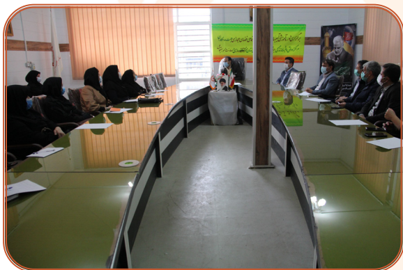
برگزاری کارگاه آسیب های اجتماعی ویژه مددکاران