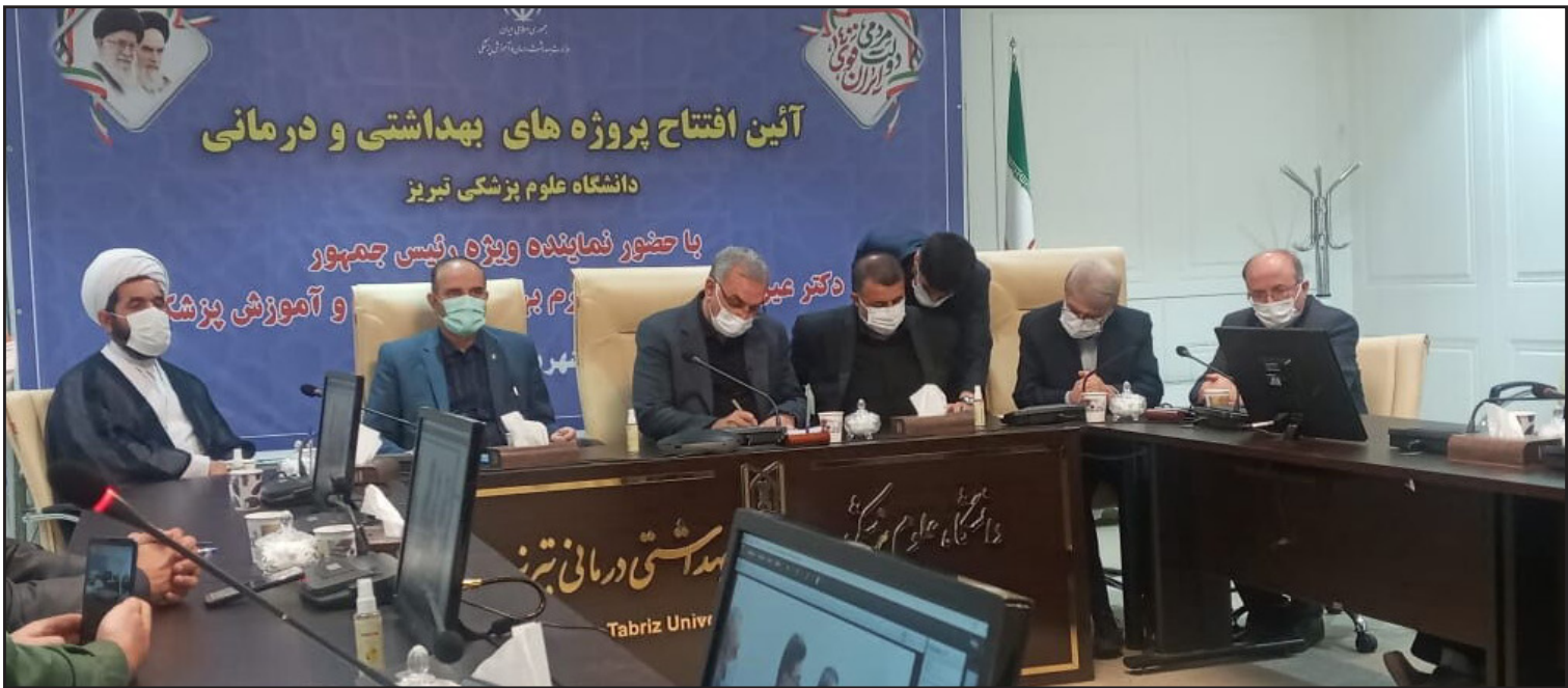
رئیس دانشگاه علوم پزشکی تبریز: