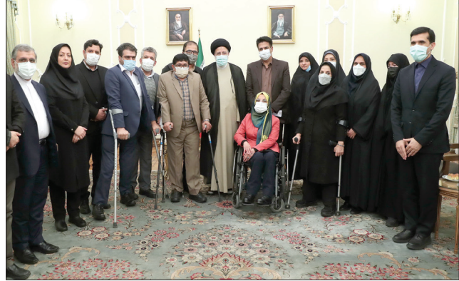
دیدار نمایندگان افراد دارای معلولیت با رئیس‌جمهور