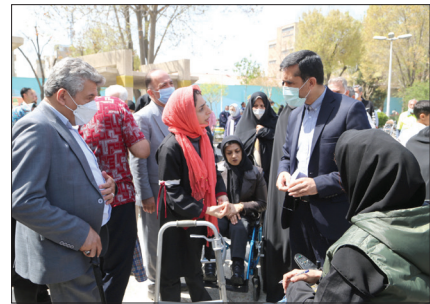
شانزدهمین عید دیدنی افراد دارای معلولیت