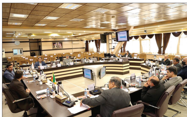
برگزاری ستاد هماهنگی و پیگیری مناسب سازی کشور