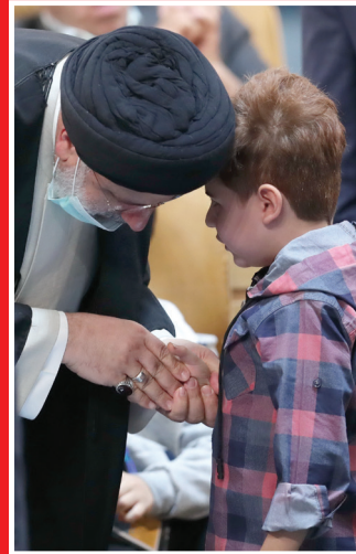
آیت الله ربیسی در مراسم گرامیداشت روز جهانی افراد دارای معلولیت