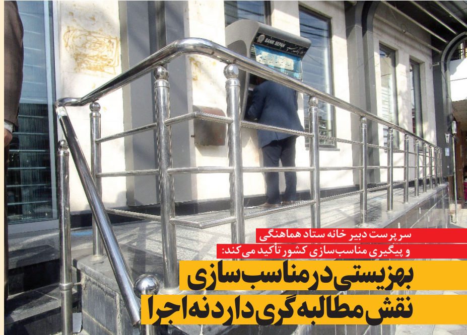
سرپرست دبیر خانه ستاد هماهنگی و پیگیری مناسب‌سازی کشور تأکید می‌کند:

پرواضح است که دسترسی پذیری کامل افراد معلول به امکانات مورد نیاز که پیام‌های روز جهانی معلولان نیز به عنوان رویکرد غالب در این عرصه مطرح می‌گردد مستلزم همکاری تمام دستگاه‌ها و باور فرد فرد ما به این واقعیت‌هاست که معلولان سرمایه‌های اجتماعی ارزشمندی هستند که استفاده مطلوب از ظرفیت آنان لازمه نوآوری و توسعه یافتگی در یک جامعه اسلامی است. لذا در تمامی قوانین مرتبط با حقوق افراد دارای معلولیت از جمله قانون حمایت از حقوق افراد دارای معلولیت و کنوانسیون حقوق افراد دارای معلولیت صراحتاً بر نقش دولت‌ها در فراگیر سازی امکانات جامعه برای افراد معلول، تأکید گردیده است. امید است با تلاش هر چه بیشتر همه نهادهای دولتی و غیر دولتی و مشارکت افراد دارای معلولیت و خانواده‌های آنان شاید جامعه‌ای شاداب، سرزنده و مناسب برای تلقین و مشارکت اجتماعی همه آحاد جامعه در تمامی عرصه‌ها برای بالندگی کشور عزیزمان باشیم.