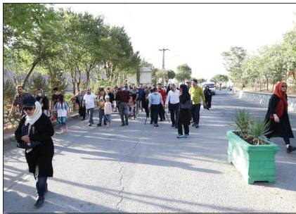
همایش پیاده روی بزرگ خانواده بهزیستی به مناسبت هفته بهزیستی