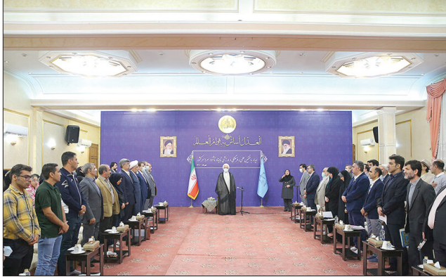
دیدار منتخبین افراد دارای معلولیت با رئیس قوه قضائیه