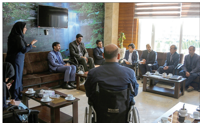
دیدار رئیس سازمان بهزیستی با تشکلهای افراد دارای معلولیت