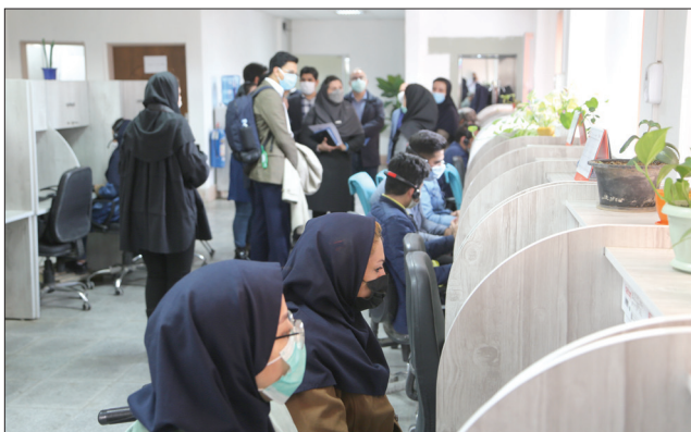
بازدید نمایندگان بین‌المللی از مراکز بهزیستی