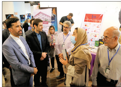
نمایشگاه دستاوردهای توانبخشی