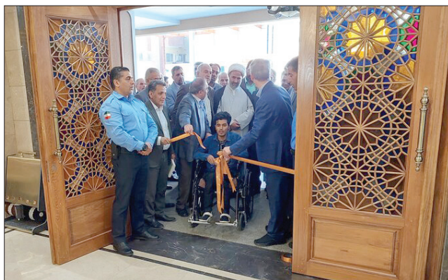
افتتاح اولین هتل مناسب سازی شده برای افراد دارای معلولیت در مشهد