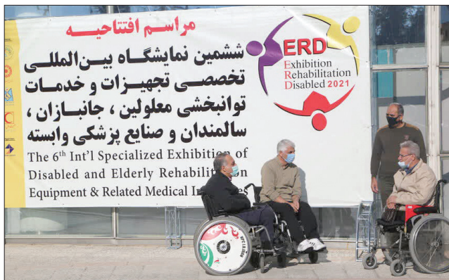
برگزاری ششمین نمایشگاه تجهیزات توانبخشی