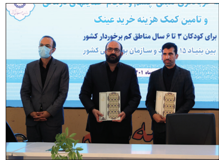
امضای تفاهت‌نامه ما بین سازمان بهزیستی کشور با بنیاد ۱۵ خرداد