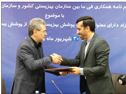
انعقاد تفاهت‌نامه فی ما بین سازمان بهزیستی کشور با سازمان بیمه سلامت کشور