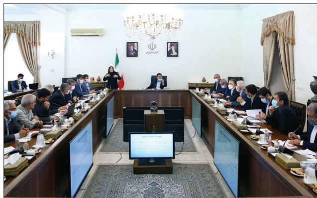
جلسه نظارت بر اجرای قانون حمایت از حقوق افراد دارای معلولیت با حضور معاون اول رئیس جمهور