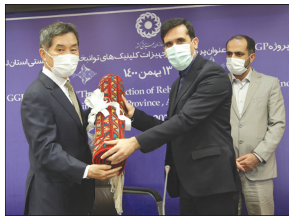
امضای تفاهت‌نامه همکاری با سفارت ژاپن