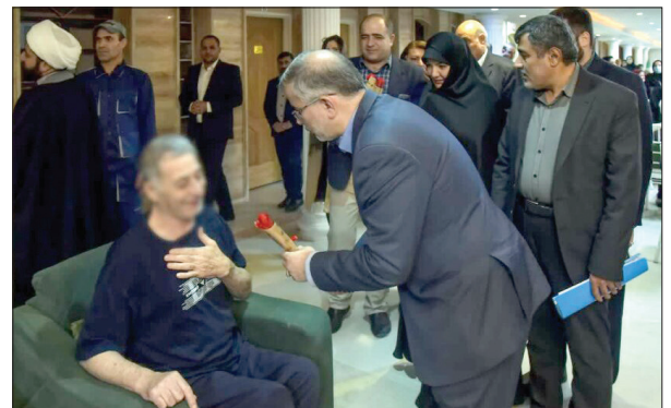
▲ افتتاح پروژه های استان فارس