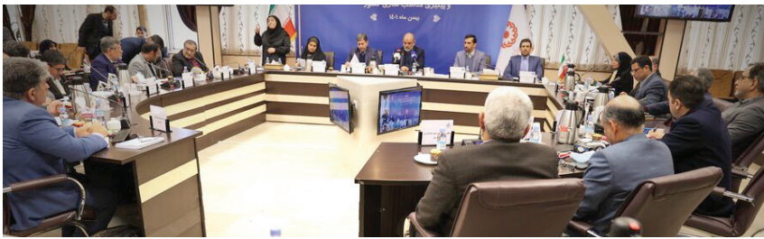
در جلسه ستاد هماهنگی و پیگیری مناسب‌سازی کشور که برای نخستین بار با حضور وزیر کشور برگزار گردید مصوب شد؛