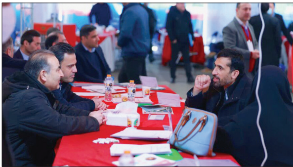
▲ میز ارتباطات مردمی و ارائه خدمات تخصصی سازمان بهزیستی در مسیر راهپیمایی ۲۲ بهمن