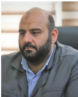
سرپرست دبیرخانه شورای مشارکت‌های مردمی بهزیستی کشور با بیان اینکه تمامی استان‌های

گفتنی است، خیرین می‌توانند با استفاده از کدهای دستوری ۷*۷۳۳* و ۵*۷۴۱* و نرم‌افزارهای آپ، سکه، ۷۲۴، ستاره یک، کیباید، پاس، همراه کارت، تپاپ، جبرینگ نیز در این امر مشارکت کنند.