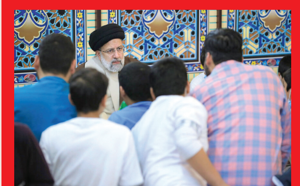
▲ ضیافت افطار رئیس‌جمهور با جمعی از فرزندان تحت پوشش بهزیستی و کمیته امداد