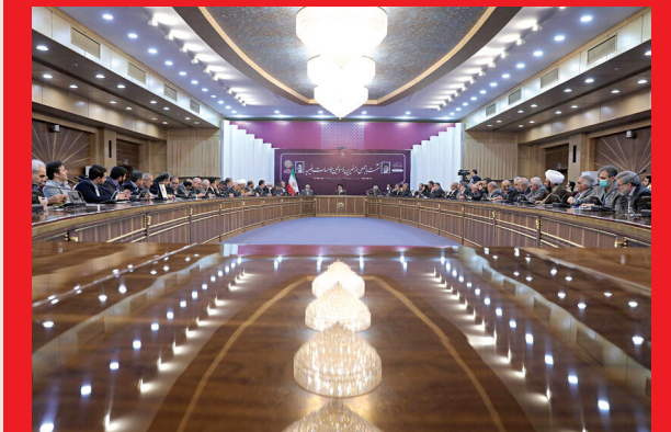
▲ دیدار رئیس‌جمهور با جمعی از خیرین و مسئولان موسسات خیریه