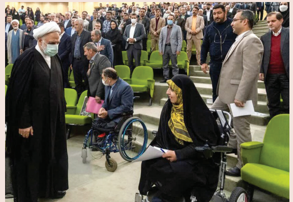
▲ دیدار افراد دارای معلولیت و اقشار مختلف مردم استان البرز با رئیس قوه قضاییه