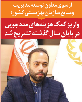
از سوی معاون توسعه مدیریت و منابع سازمان بهزیستی کشور: