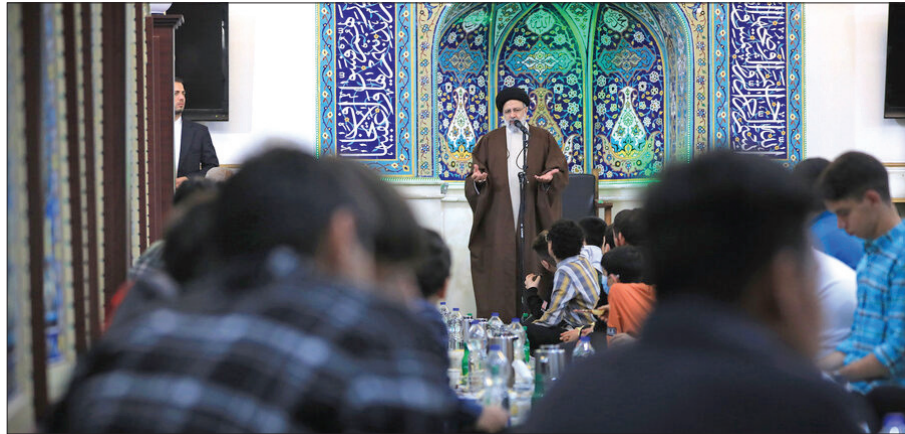
رئیس‌جمهوری در ضیافت افطار با جمعی از فرزندان بهزیستی:

آیت‌الله رئیسی همفکری و همراهی دولت و خیرین را موجب چند برابر شدن ظرفیت و توان مقابله با محرومیت و فقر در کشور عنوان کرد و با تأکید بر اینکه فقر زیننده کشور اسلامی نیست، تلاش مضاعف همه دست‌اندرکاران و مسئولین مرتبط را برای رخت بر بستن فقر و محرومیت‌زدا کشور خواستار شد.