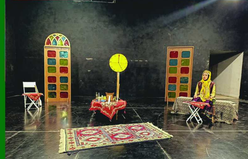
خنده زدن لب نمی‌خواود داریه و تنبک نمی‌خواود یه دل می‌خواود که شاد باشه از بند غم آزاد باشه