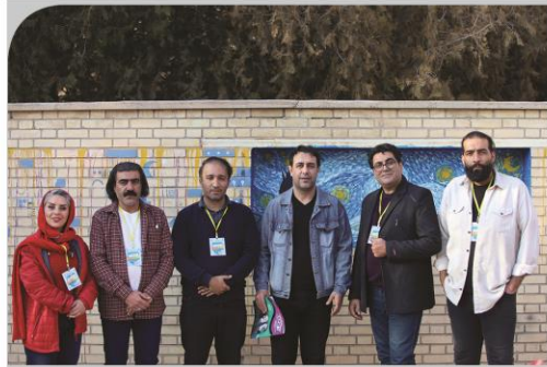
مسئول محتوای فرهنگ و هنری امیرکبیر: رضا وله پور، دستیاران: ابوالفضل آرش، اکریجه هادی امیدی