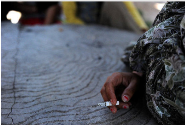
مدیر بهزیستی شهرستان مشهد از راه اندازی نخستین مرکز حمایت از بانوان باردار گرفتار اعتیاد

دکتر فیروزی افزود: بر اساس آیین‌نامه اجرایی مراکز ماده ۱۶ وظایف هر یک از دستگاه‌های عضو، در اداره این مراکز مشخص شده و همه‌ی دستگاه‌هایی که در این آیین‌نامه وظایف آنها مشخص گردیده باید نسبت به وظایف‌شان پاسخگو باشند.