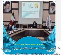
به گزارش افق مشهد، استاندار خراسان رضوی با استاندار خراسان رضوی در جلسه ستاد مناسب‌سازی استان خراسان رضوی در مسیر زائرسرای معلولین به حرم مطهر رضوی خبر داد.

هماهنگی عمرانی استاندارد خراسان رضوی از تعیین مهلت سه ماهه برای رفع نقایص مناسب‌سازی در مسیر زائرسرای