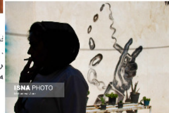
عکس تزئینی است.

ایستنا/خراسان رضوی صدای دست، جیغ، خنده و شادی اولین صدایی است که اینجا می‌شنوم. رد صدا را می‌گیرم. به سالنی می‌روم که جشن در آن برپاست. چهره اغلب زنان سیاه و کبود است و جای خالی دندان‌هایشان موقع خندیدن تو را با سپاهی عمیقی روبه‌رو می‌کند.