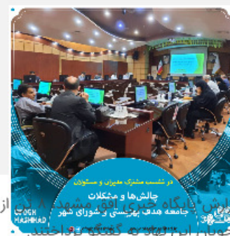
در نشست مشترک مدیران و مسئولان چالش‌ها و مشکلات جامعه هدف بهزیستی و شورای شهر دیدار و گفتگو برگزار شد.

به گزارش پایگاه خبری افق مشهد، ۸ تن از منتخبین شورای شهر ششم مشهد مقدس با مدیران بهزیستی خراسان رضوی دیدار و در خصوص مشکلات و نیازهای مددجویان این نهاد به گفتگو پرداختند. در این دیدار که در سالن اجتماعات بهزیستی خراسان رضوی برگزار شد مدیران بهزیستی، چالش‌ها، کاستی‌ها و مشکلات مربوط به مطالبات از متقاضیان [شورای شهر ششم مشهد مقدس با مدیران بهزیستی خراسان رضوی دیدار و در خصوص مشکلات و نیازهای مددجویان این نهاد به گفتگو پرداختند.