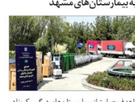
اهدای ۶۰۰ قلم تجهیزات پزشکی به بیمارستان های مشهد