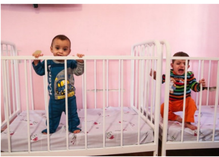
گروه استان‌ها- فرآیند دشوار و طولانی فرزندخواندگی مسئله‌ای است که فقط در اذهان وجود دارد چراکه اینک این پروسه با لحاظ مسائل قانونی تسهیل شده است.

۱۴ مرداد ۱۴۰۰ - ۱۲:۱۳ | اخبار استانها | اخبار خراسان رضوی