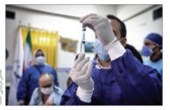
دبیر فراگانه عملیاتی مقابله با کرونا در استان خبر داد: وعده وزیر بهداشت برای تامین ۷۰ هزار دوز واکسن استان...