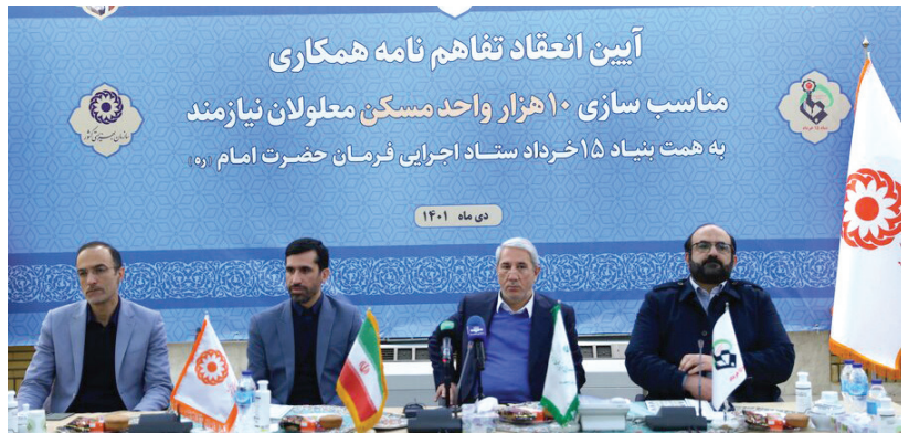
▲ آیین انعقاد تفاهم‌نامه همکاری مناسب‌سازی ۱۰ هزار واحد مسکونی معلولان نیازمند