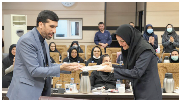
▲ نشست صمیمانه رئیس سازمان بهزیستی کشور با بانوان شاغل