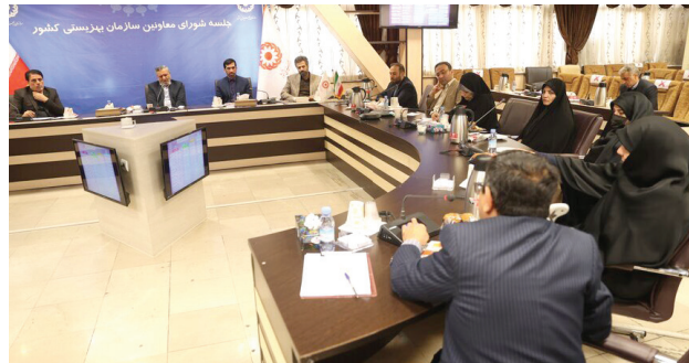
▲ برگزاری جلسه شورای معاونین سازمان بهزیستی با حضور وزیر تعاون، کار و رفاه اجتماعی