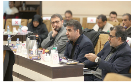
▲ همایش تخصصی مدیران ستادی و استانی بهزیستی کشور