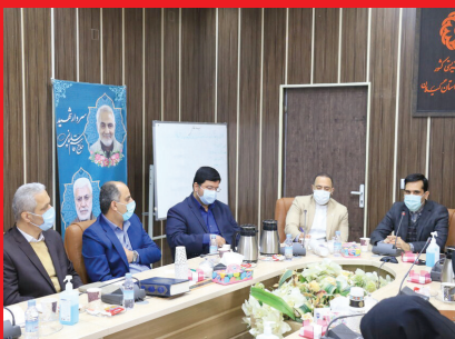
▼ سفر رئیس سازمان بهزیستی کشور به ۸ استان و دیدار با مددجویان و کارکنان