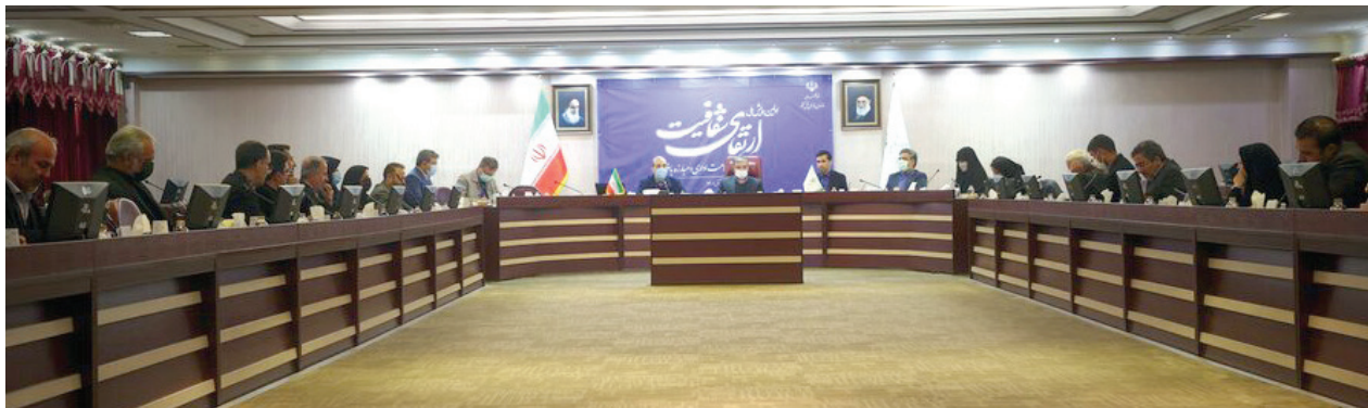
▲ جلسه بررسی نحوه اجرای قانون حمایت از حقوق معلولان در سازمان بازرسی کشور